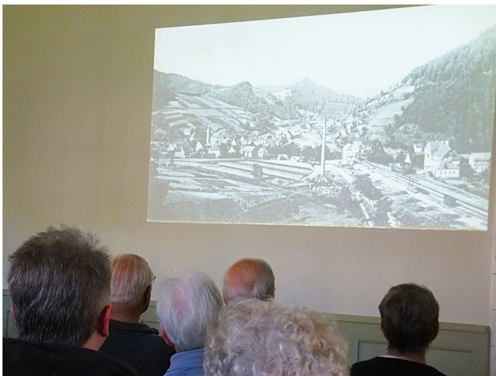
Schenkzell Ende des 19. Jahrhunderts mit der neu erbauten Eisenbahnlinie