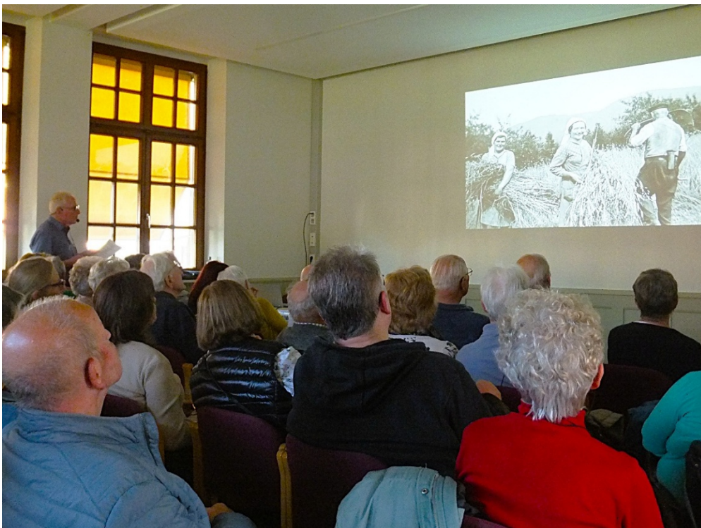
Bei der Getreideernte