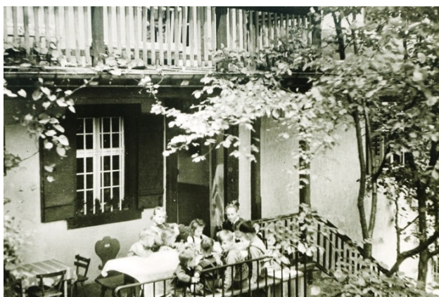
Kinder vor dem ehemaligen Kinderheim

Ab den 1920er Jahren war das Haus in der Hohensteinstraße 7 ein Kinderheim.