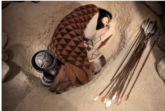
Bestattungshaltung der Glockenbecherkultur

Schwerpunkt der historischen Literaturrecherche von Helmut Horn ist die prähistorische Geschichte aufgrund genetischer Forschungserkenntnisse.