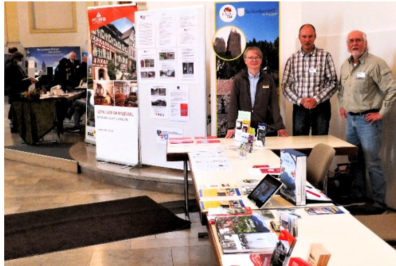
Unser Gemeinschaftsstand 2022 in Oberndorf/N.