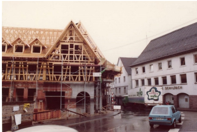
Veränderungen im Vorstädtle: Umbau des Lehengerichter Rathauses, rechts daneben noch die ehem. Volksbank (der frühere „Ochsen“)

Doch das heutige Stadtbild wurde in den vergangenen Jahrzehnten auf Basis der vorhandenen Substanz ausgeprägt. Die im Jahr 1974 begonnene Stadtsanierung hat wesentlich dazu beigetragen.