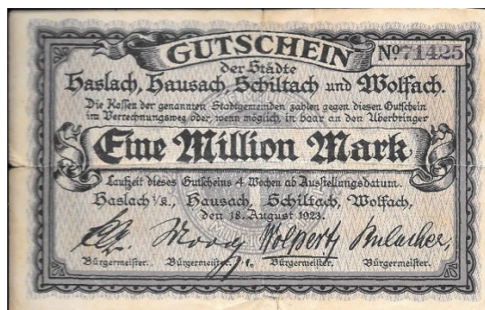
Kinzigtäler Notgeld herausgegeben vom August 1923

Werde ich mir Nötiges und Liebgewonnenes morgen noch leisten können? Der Blick auf die Preisschilder sorgt in Zeiten der Inflation für Sorgen. Immer wieder gab es solche Zeiten, in den das Geld an Wert verlor. Nie sollten die Deutschen aber eine solche Teuerung erleben, wie in den Jahren nach dem Ende des Ersten Weltkrieges.