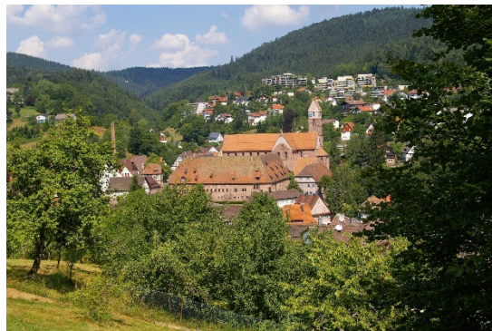
Blick auf das ehemalige Kloster und die Stadt