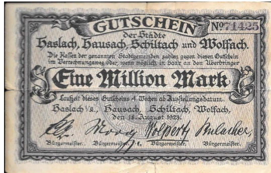
Kinzigtälner Notgeld herausgegeben vom August 1923

Veranstaltung in Kooperation mit der VHS Schiltach-Schenkenzell 19.30 Uhr im Adler-Saal (DG Restaurant Adler 1604, Seiteneingang, barrierefrei erreichbar), Schiltach, Eintritt € 4,-- an der Abendkasse