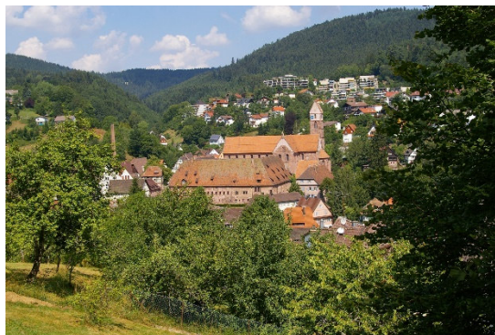
Blick auf das ehemalige Kloster und die Stadt