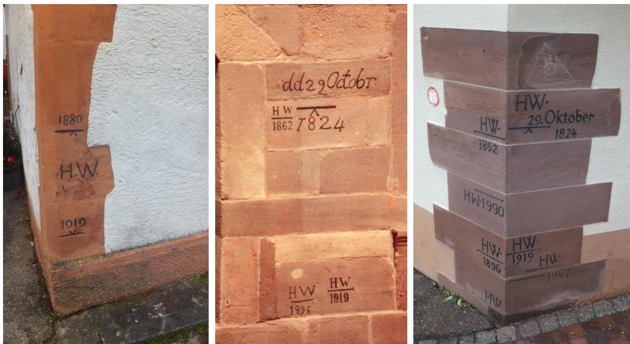
Hochwassermarke am Haus Bachstraße 17 (li.) an der Schiltach, auf dem Schleifengrün, an der Einmündung der Schiltach in die Kinzig (Mitte) und am Haus Hauptstraße 29 an der Kinzig.

Auch über die Kinzig kamen von Alpirsbach her weitere Wassermassen mit großen Mengen Treibholz nach Schiltach. Ähnlich sah es auch in fast allen anderen Städten und Gemeinden des Kinzigtals aus. "Es waren bange Stunden, die die Schiltacher erleben mußten", schrieb das "Schwarzwälder Tagblatt" mitfühlend, "und auch ihnen wird der hl. Abend 1919 unvergeßlich bleiben."