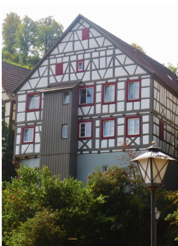
Nordseite des Hauses Marktplatz 9 mit „s'Schulze Gässle“ (re.)