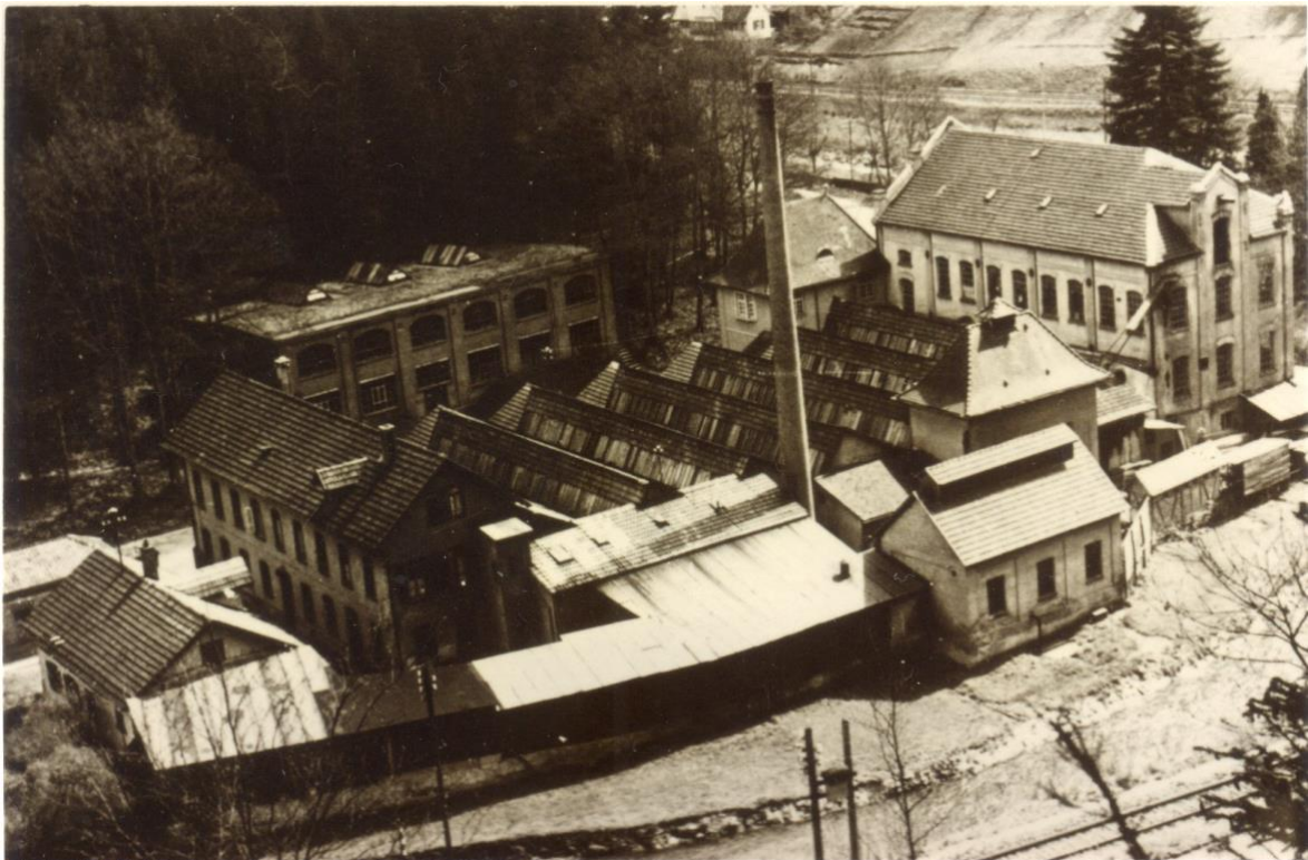
Die ehemalige Korndörfer'sche Tuchfabrik um 1950 mit dem zweistöckigen Wohnhaus (vorne links)