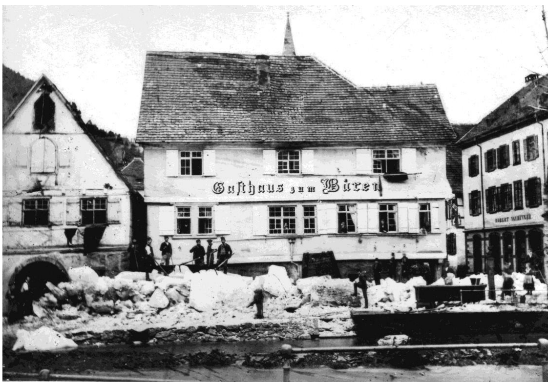
Schiltacher Flößer beim Beseitigen der Eisblöcke in der Bachstraße

Auch in Schiltach ging man daran, die Eisberge um die Stadtbrücke, in der Bachstraße und im Vorstädtle zu beseitigen und die Schäden an Häusern, Straßen, Wegen und Gärten zu begutachten. Ganz zerstört war das Wehr oberhalb der Stadtbrücke, von dem das Wasser zur Äußeren Mühle geleitet wurde und das der Müller Johann Georg Wolber neu erbauen musste. Das prägnante Wasserbauwerk wurde im Zuge des Hochwasserschutzes 2016 beseitigt.