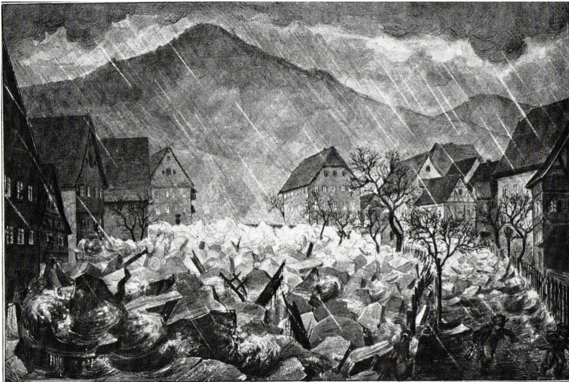
Neujahr 1880: Der Eisgang auf der Schiltach oberhalb der Stadtbrücke Zeichnung: Karl Eyth

Er kam nicht überraschend, der Eisgang an Neujahr 1880: Städtische Arbeiter waren noch unterwegs, um zu warnen. Doch wurde seitens der „Einwohnerschaft Schiltachs“, wie es hieß, „fast gar nichts getan, um der Katastrophe vorzubeugen“, die Warner sollen „sogar bedroht worden sein.“ Als sich dann in der Frühe des 1. Januar die Eismassen auf der Schiltach in Bewegung setzten, stauten sie sich schnell an der erst 1864 erbauten eisernen Stadtbrücke. Sie hielt dem Druck stand, doch schoben die „hochgehenden Wogen die größten Eisschollen über die Ufer, auf die Wege und in die Gärten, alles mit sich reißend.“ Eisberge wälzten sich ins Vorstädtle, am „Bären“ wurden Schopf und Stall mit Eis aufgefüllt, wobei aber niemand zu Schaden kam.