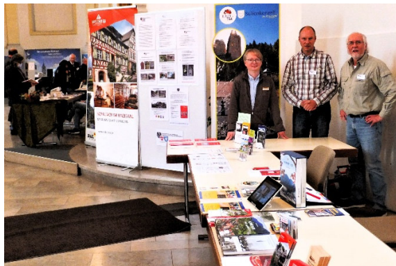
Unser Gemeinschaftsstand 2022 in Oberndorf/N.