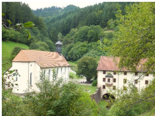
Was vom ehemaligen Kloster erhalten blieb

19.00 Uhr im Klostersaal Wittichen (Gem. Schenkenzell)