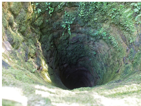
Der in den 1960er Jahren freigelegte Brunnen

Der Name „Schlöble“ für den Berg über dem Schwenkenhof deutete schon immer auf eine alte Befestigung hin, ebenso der Wall, der den Gipfel umgibt. Man vermutete einen keltischen Ringwall oder römischen Wachturm, doch brachten erst Grabungen der Heimatfreunde Fritz Laib und Herbert Pfau 1959–1970 Aufschluss: Sie fanden die Ruinen einer mittelalterlichen Burg, die auf alten Landkarten als „Willenburger Burgstall“ verzeichnet ist. Die Exkursion des Historischen Vereins soll die Überreste und Funde erklären und auf die Bedeutung der Anlage eingehen, die schon vor der Gründung der Stadt Schiltach um 1240 bestanden hat.