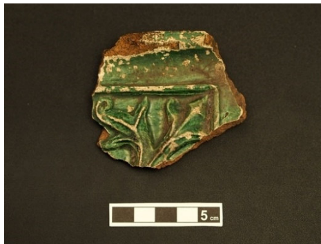
Bruchstück einer Ofenkachel vom ehemaligen Schiltacher Schloss

In ihrem Vortrag gehen sie auf die mittelalterliche Siedlungslandschaft um Schiltach ein. Sie berichten über archäologischen Baustellenbeobachtungen in Schiltach und Schenkenzell und über Funde, die sie im Bereich einer Hofwüstung im Reichenbächle und einer bei Wittichen gemacht haben. Sie stellen des weiteren Funde aus der Region vor, z. B. von der Burg Schiltach, der Burg Wittichenstein, der Klingenburg und dem Schlössle bei Schenkenzell.