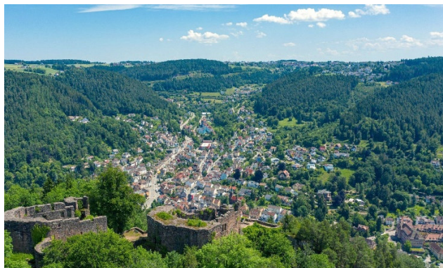
Blick auf die Ruine Hohenschramberg und die Stadt

Die historischen Wurzeln des heutigen Mittelzentrums im Landkreis Rottweil sind vielgestaltig: Im Mittelalter bestanden im Raum Schramberg zunächst mehrere Adelherrschaften, deren Besitzungen in der Mitte des 15. Jahrhunderts in der „Herrschaft Schramberg“ zusammengefasst wurden, die 1547 das Marktrecht erhielt und seit 1583 vorderösterreichisch war. Seit 1648 war die Herrschaft im Besitz der Freiherren (später Grafen) von Bissingen, 1805 wurde sie württembergisch. 1820 begann mit der Gründung einer Steingutfabrik das Zeitalter der Industrialisierung, bis weit in das 20. Jahrhundert hinein waren vor allem Uhrenindustrie und Wehrtechnik prägend. Der Marktflecken wandelte sich zur Industriestadt, die sich zudem durch drei Eingemeindungen vergrößerte. Der Referent wird als Historiker und Kulturwissenschaftler und Leiter des Stadtarchivs und Stadtmuseums Schramberg ein stadtgeschichtliches Porträt präsentieren und die historischen Berührungspunkte zwischen Schramberg und Schiltach aufzeigen.